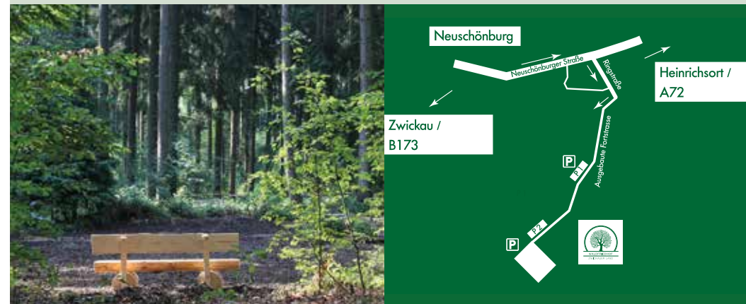
Maigrün empfangen die Buchen die Besucher im Waldfriedhof

Die Einfahrt befindet sich am Ende der Ringstraße im Ortsteil Neuschönburg. Von dort erreicht man den Waldfriedhof über eine ausgebaute Forststraße nach ca. 1 Kilometer.