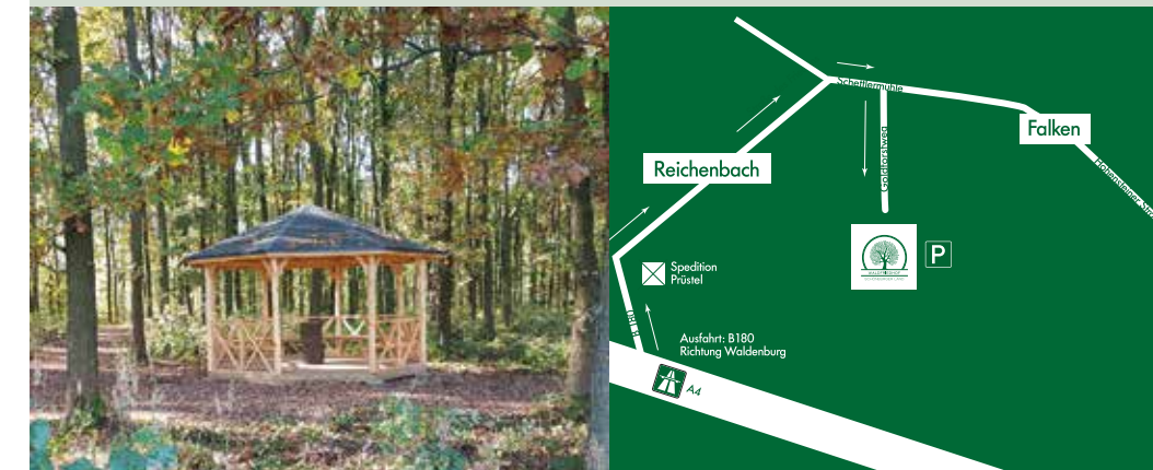
Blick auf den Pavillon im Herbst – ein Ort zum Verweilen und Innehalten

Die Einfahrt zum Waldfriedhof erfolgt über eine Plattenstraße gegenüber dem Sportplatz der SG Callenberg. Den Parkplatz des Waldfriedhofes erreichen Sie nach ca. 500 Metern.