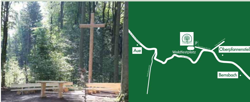
Sommerlicher Blick auf den Andachtsplatz

Die Einfahrt zum Waldfriedhof erreichen Sie von Aue kommend linker Hand am Ortseingang des Ortsteiles Oberpfannenstiel. Biegen Sie scharf links in den Ableger der Auer Straße und nach ca. 300 Metern erreichen Sie über eine gut ausgebaute Forststraße den Parkplatz des Waldfriedhofes.